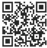
乗り方・降り方編