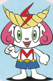
志免町公式キャラクター シメッチャ